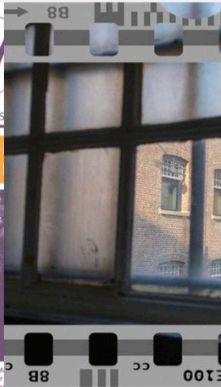
Open Monumentendag Filmfestival