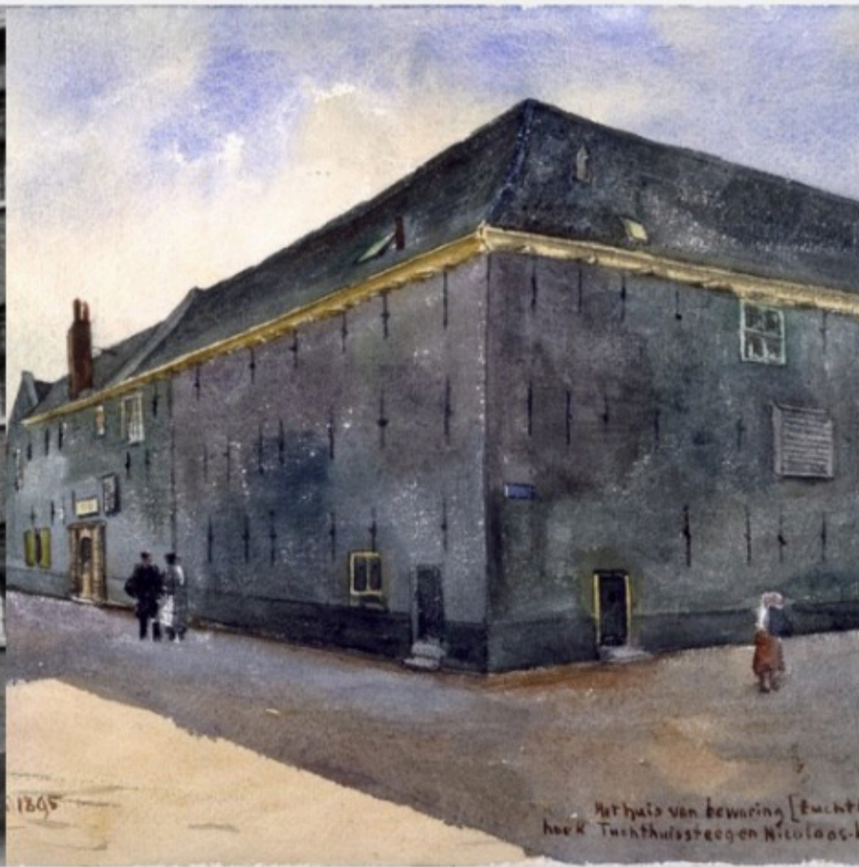
Boeiende vraag #1: bestaan gevangenissen al lang?