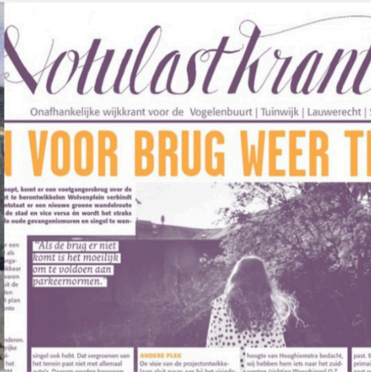
Tijden en inzichten veranderen